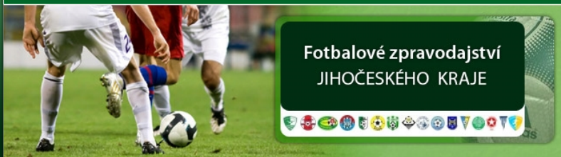
FOTO: Řepeč-Opařany se vrátily k tradičním dresům a zmasakrovaly Chotoviny