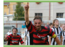
FOTO: Fotbalisté Řepče-Opařan uhájili před Mladou Vožicí naskok i v deseti