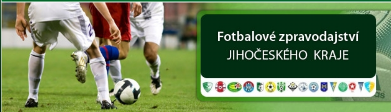
FOTO: Poslední Albrechtice nevyhrály již sedmáct zápasů v řadě! Černou sérii nezlomily ani v Řepči